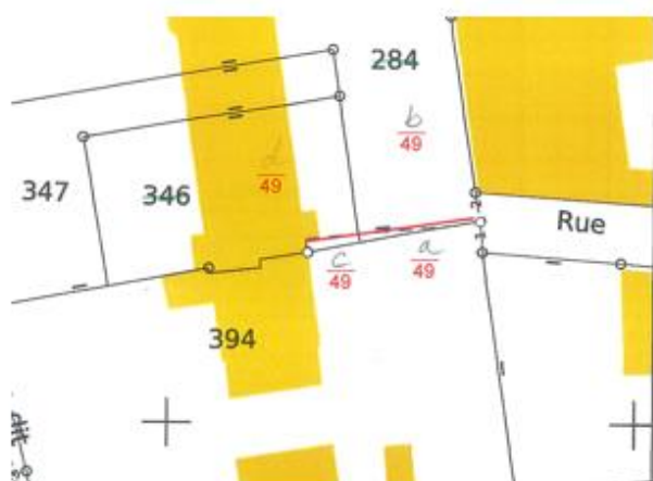
Terrain BERNAUER ( 11 m²)